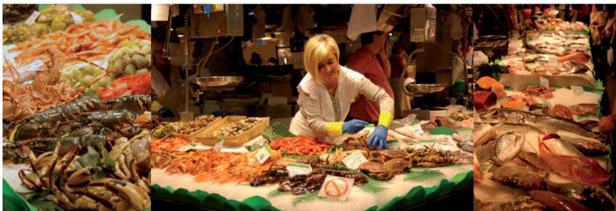
Abbildung 1: Reichhaltiges Angebot an Fischen und Meeresfrüchten auf einem Fischmarkt in Barcelona