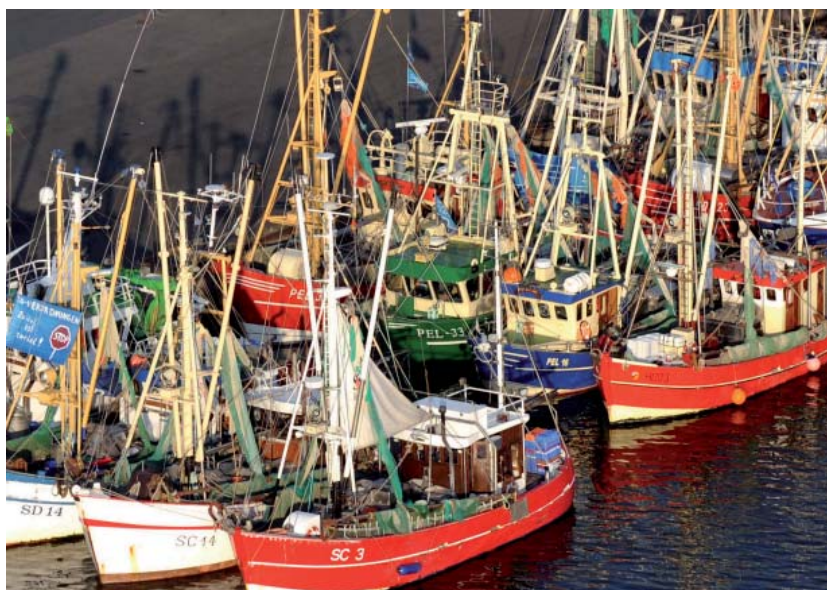
Abbildung 3: Mit der größten Kutter-Zusammenkunft der vergangenen 60 Jahre haben am 30.06.2009 Nordsee-Fischer im Fischereihafen Bremerhaven gegen neue Auflagen der Europäischen Union und den Erhalt der Küstenfischerei protestiert.

Die Befunde aus MPAs kalt-gemäßigter Breiten sind ähnlich. In mehreren langfristigen, großen Schutzgebieten vor der Ostküste der USA wurden zunehmende Artenzahlen, Individuenzahlen und Biomasse der benthischen Megafauna verzeichnet. Mehr Individuen der Epifauna erreichten adulte Größe;