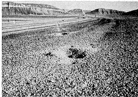
Fig. 2. Eine der jungen Muldenlinien. Der letzte Streckenteil des am weitesten gewanderten Steines

Unterseite und zu dem darunter liegenden Schotter entstanden, daß eine Störung sofort auffallen würde. Die Mulden und die sie umgebenden Wälle fallen auch dadurch besonders auf. Bei diesen gewanderten Steinen kann man zwei Gruppen beobachten. Eine ältere, bei der die wannenartigen Vertiefungen mit Vegetation ausgekleidet, und deren Umwallungen mehr oder weniger eingeebnet sind, und eine jüngere, deren Mulden und Wälle ganz frisch erscheinen (Fig. 2)