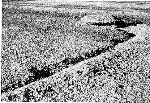
Fig. 3. Dieser Block pflügte auf der letzten Strecke den Schotter auf

pflügt er die letzten 12 m den Schotter auf und wendet sich dabei in engem Bogen wieder nach Norden. Das Ausräumen des Schotters unter dem Stein geht auf diesem letzten Stück nur nach der Bogenaußen-seite (Fig. 3)