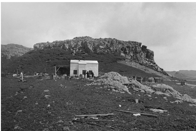
Abb. 6: Das Stationshaus. Im Hintergrund der Stationsberg.