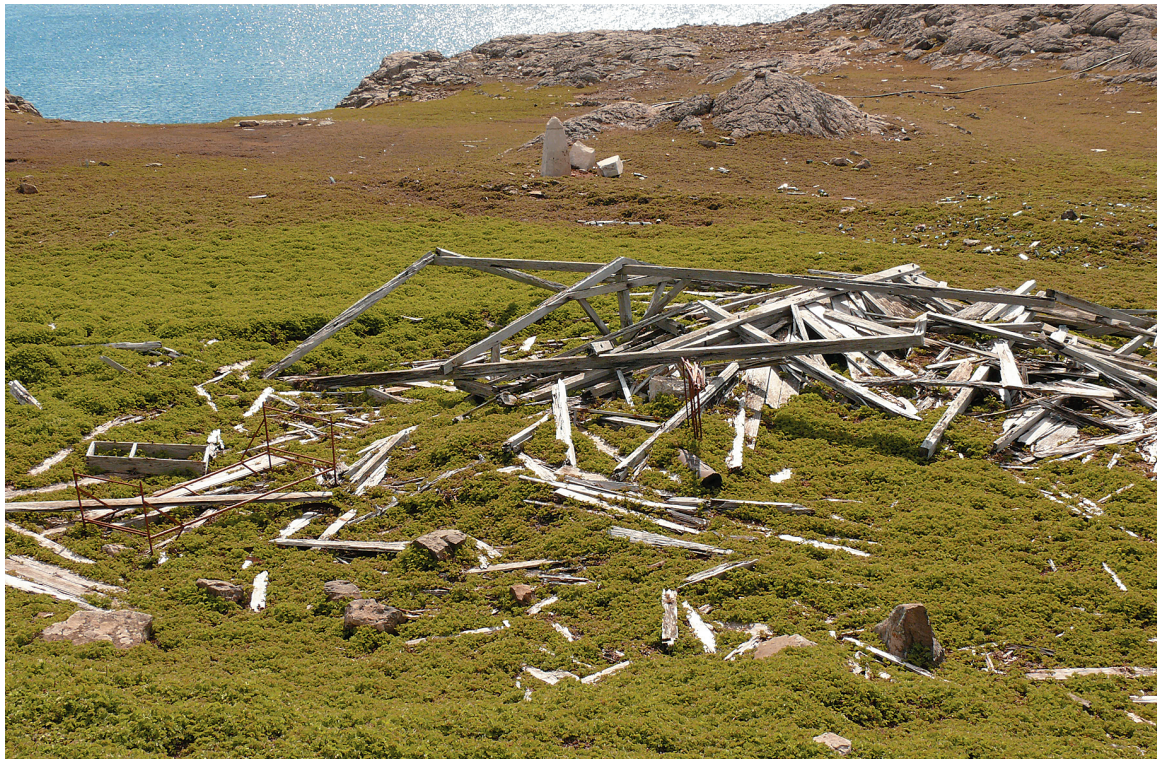
Abb. 3: Die Reste des Stationshauses vor Beginn der Grabung. Im Hintergrund sind die Passagesteine zu sehen.