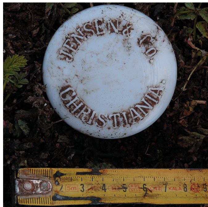
Abb. 12: Flaschendeckel mit der Beschriftung „JENSEN & Co. CHRISTIANIA“ aus der Fundstelle „Maison Culet“ deutet auf Kontakte nach Norwegen hin.

Zahlreiche Reste von Türen und Fenstern, die sich kaum von den entsprechenden Funden aus dem Stationshaus unterschieden, konnten geborgen werden. In mindestens einem Fall erwies sich eine Klinke aus der Fundstelle „Maison Culet“ als identisch mit einer Klinke aus einer Tür aus dem Wohnhaus. Linoleum wurde auch gefunden, aber nur in geringerer Menge. Korkschrot kam hingegen nicht zum Vorschein. Interessant war, dass die Beschriftungen auf den Kleinfunden niemals in französischer Sprache abgefasst waren. Auf insgesamt fünf Fundstücken war der Produktionsort oder das Herstellungsland abgedruckt: „Castleford“ auf einem Glasbruchstück, ein Bruchstück einer Flasche mit der Aufschrift „Wales“, eine Flasche und ein Glasdeckel mit „Christiania“ und eine Lampe mit „Made in Saxony“. Zwei Artefakte kommen also aus dem Vereinigten Königreich, zwei aus Norwegen („Christiania“ ist die alte Bezeichnung für Oslo bis 1877; Abb. 12) und eines aus Deutschland. Man kann also erkennen, dass bis auf die Reagenzgläser kaum wesentliche Unterschiede in den Kleinfunden aus dem Stationshaus und