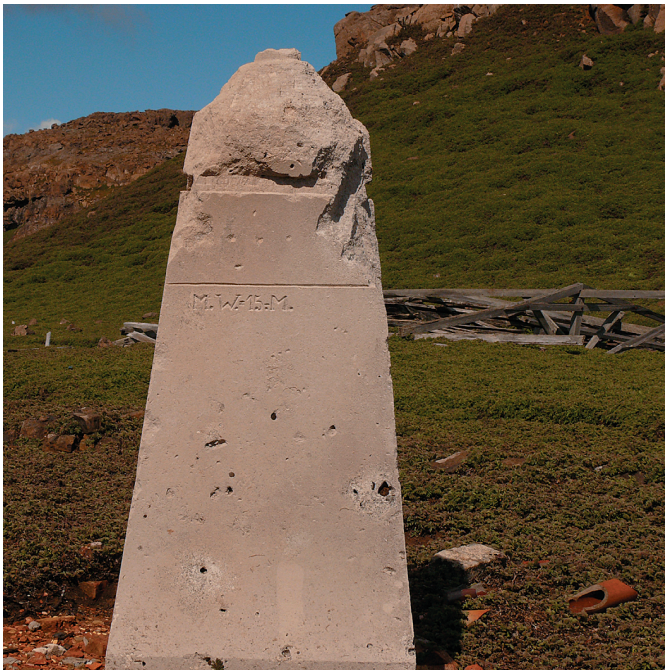
Abb. 11: Detailaufnahme des noch stehenden Passagesteins. Die Inschrift und die grobe Bearbeitung der Spitze sind gut zu erkennen.

Während der Grabung wurde intensiv nach Inschriften oder anderen Texten gesucht, die über die Geschichte des Siedlungsplatzes Auskunft geben könnten. Auf dem stehenden Passagestein konnte man die Inschrift „M.W. = 15.-M.“ sehr gut lesbar finden. Mangels einer plausibleren Idee wurde während der Grabung gemutmaßt, dass damit „Mittlerer Wasserstand = 15 Meter“ gemeint war. Gestützt wird diese These dadurch, dass sich die Steine tatsächlich etwa 15 m über dem Meeresspiegel befinden und sie mit 15 m auch auf der deutschen Karte der Stationsumgebung als Höhenangabe vermerkt sind. Auf einigen Holzresten des Stationshauses fand sich die Inschrift „K.L.“, deren Bedeutung bis jetzt ungeklärt ist. Es ist jedoch aus einem Brief bekannt, dass J. Enzensperger den Verlust einer Kiste mit der Kennzeichnung „K.L. 11“ (TARIQ) bemerkte. Die Abkürzung „K.L.“ ist also im Zuge der ersten deutschen Südpolarexpedition nicht ungebräuchlich gewesen und ist somit ein weiteres Indiz, dass das Stationshaus aus dieser Zeit stammt. Außer einiger Bundeszeichen am Stationshaus sind keine weiteren Inschriften an den Gebäuden bekannt.