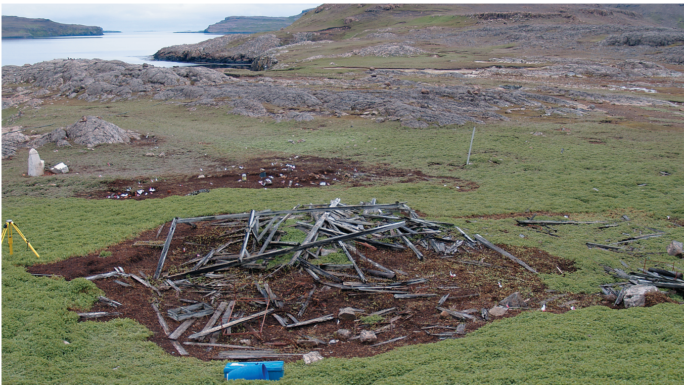
Abb. 4: Das Stationshaus nach dem Entfernen des Acaena -Bewuchses.