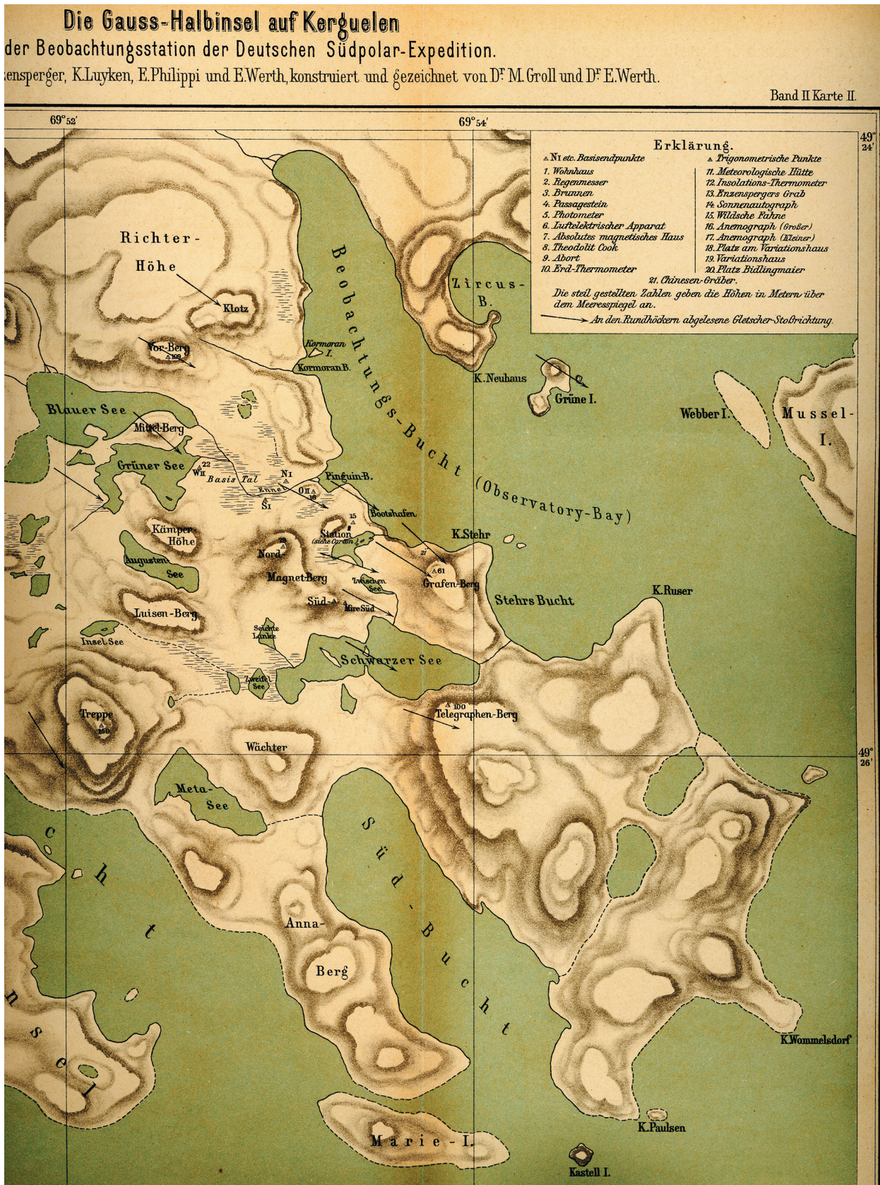
Abb. 2: Karte der Gauss-Halbinsel mit der Umgebung der Kerguelenstation an der Beobachtungs-Bucht, erstellt 1902. Solche Karten waren während der Ausgrabungen 2006/07 eine wichtige Orientierungshilfe (aus WERTH 1906).