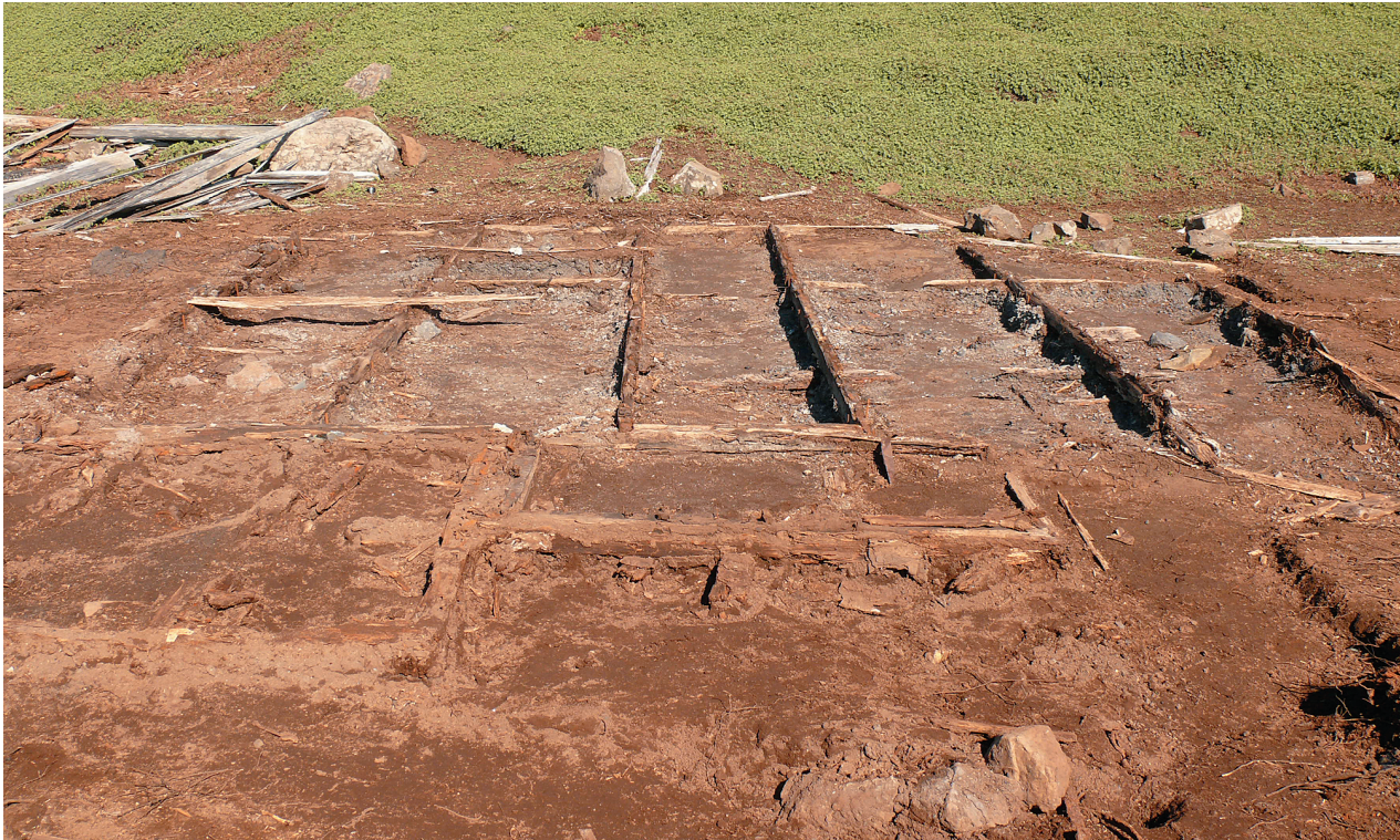
Abb. 5: Das freigelegte Fundament des Stationshauses. Die „englischen“ Balkenstücke quer zu den darüber liegenden Balken sind gut zu erkennen. (Foto: Barbot).