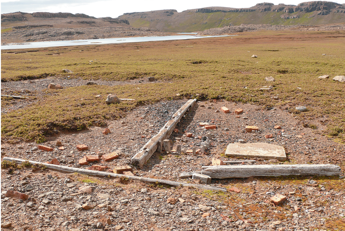
Abb. 8: Die oberirdisch sichtbaren Reste des Variationshauses vor der Grabung (Foto: Barbot).

Sicherlich eines der auffälligsten Zeichen des Siedlungsplatzes an der Beobachtungsbucht sind die „Passagesteine“ (Abb. 11). Es handelt sich hierbei um zwei etwa eineinhalb Meter hohe weiße Steinpfeiler, die sich etwa 15 m östlich vom Wohnhaus befanden, wobei sie aber überraschenderweise auf keinem historischen Foto der ersten deutschen Südpolarexpedition abgebildet sind. Die Pfeiler wurden wohl von der britischen Expedition zu den Kerguelen gebracht um einem Fernrohr zur Beobachtung des Mondes einen sicheren Stand zu geben. Der eine der beiden Pfeiler stand zu Beginn der