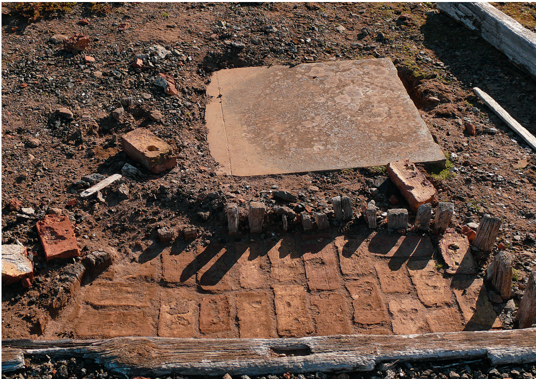
Abb. 9: Das gezielte Fundament innerhalb des Variationshauses.