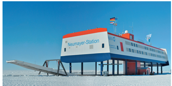
Abb. 1: Neumayer-Station III am Tag der Einweihung, 20. Februar 2009. Das etwa 2.600 t schwere Bauwerk ist im Eis gegründet. Die Plattform ist 68 m lang und 24 m breit. Sie befindet sich 6 m über der Schneeoberfläche. Hier sind die wissenschaftlichen und technischen Einrichtungen untergebracht. Die Gesamthöhe einschließlich Ballonhalle auf dem Dach beträgt 21 m. Die Garagensektion unter der Schneeoberfläche ist 76 m lang, 26 m breit und 8 m tief. Über eine Rampe an der Nordseite können die Fahrzeuge in die Garage gefahren werden (Foto: U. Cieluch, AWI).

Bei der Konzeption der Neumayer-Station III wurden neue Wege beschritten, damit sowohl die baulichen Anforderungen an eine nachhaltige Lebenszeit des Gebäudes sowie auch an die moderne Ausstattung für Forschung und Logistik, an verbesserte Lebens- und Arbeitsbedingungen für die Überwinterung und an die Unterbringung von zusätzlichem Personal in