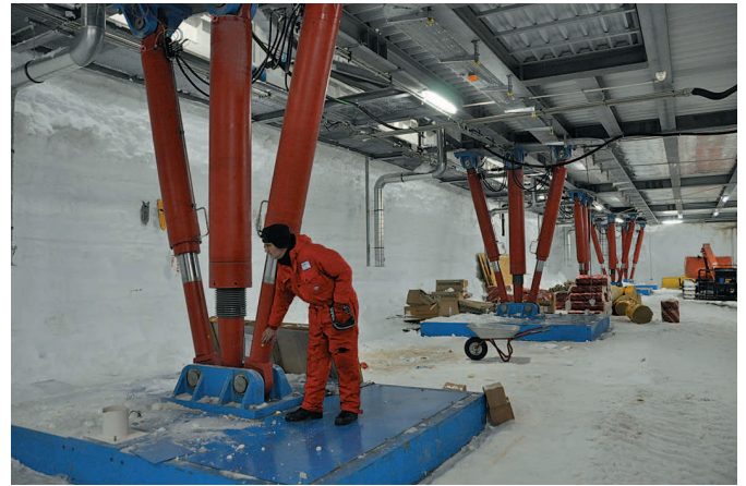
Abb. 3: In der Garage befinden sich die 16 Stützen, die als Bipoden mit je zwei Hydraulikzylindern ausgebildet sind. Das flexible Tragsystem gleicht Fundamentsetzungen aus, leitet horizontale Lasten in den Schneegrund ab und einmal im Jahr wird damit das Bauwerk als ganzes angehoben. Anschließend werden die Fundamentplatten nacheinander angehoben und mit Schnee unterfüttert.

Die wissenschaftlichen und technischen Einrichtungen sind in vier Ebenen untergebracht. In der Garage (Deck U2) stehen die Fahrzeuge und anderes Großgerät. In die Stahlkonstruktion