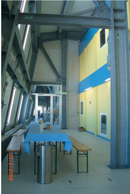
Abb. 4: Auf Höhe Deck 1 zwischen der Außenhülle (links) und den in zwei Ebenen montierten Modulen (rechts) steht weitere geschützte Nutzfläche zur Verfügung.