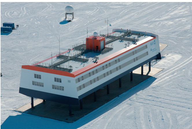
Abb. 5: Auf dem Dach des Gebäudes (Deck 3) befindet sich die Ballonfüllhalle. Wissenschaftliche Instrumente und Antennen sind auf den Gitterrosten und an den Geländern montiert. Im Hintergrund steht das Radom mit der Satellitenantenne für die Standleitung.