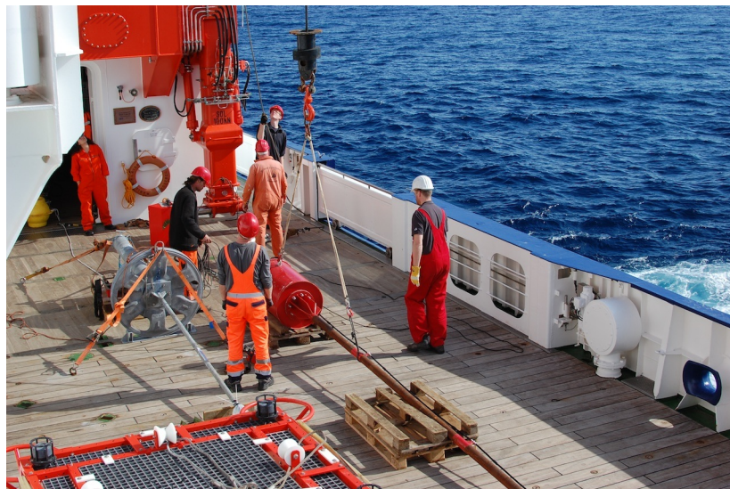
Die Porendrucklanze (links) und die Temperaturlanze (rechts) auf dem Arbeitsdeck kurz vor dem Aussetzen.