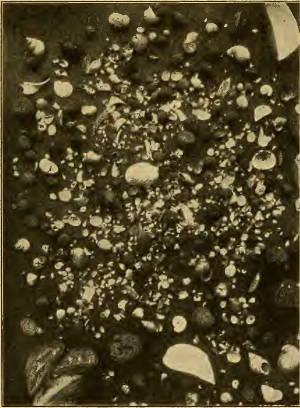
Seeerz, Molluskenschalen und deren Trümmer aus Tiefenschlamm des Madüses bei Seelow ausgesiebt. Natürliche Größe.

größeres Sandkorn nachzuweisen (Fig. 5 u. 6). Mit Salzsäure übergossen, brausen die Kugel auf, die Säure wird sofort gelblich und beim Erhitzen tief gelb. Aus dieser gelben Lösung fällt Ammoniak das Eisen als Eisenoxyd aus. Die meisten der größeren Kugeln zerfallen auch beim wiederholten Kochen mit Salzsäure nicht vollständig, es bleiben größere Scherben zurück, die sich mit dem