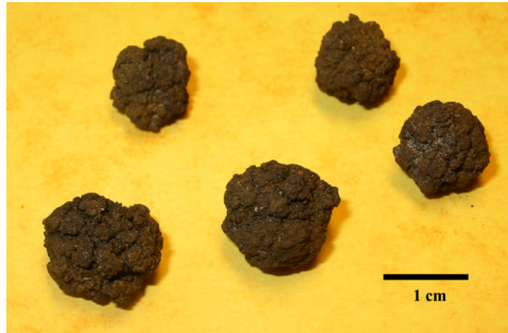
Fig 4. Sfäriska noder med ojämn knölig yta. (Provtagningsstation 1979-24)

sedimentområden som har påverkats något av bottenerosion. De äldsta koncretionerna i Bottenviken antas vara omkring 3000 år. I Bottenviken uppskattas tillväxthastigheten till mellan 0.15-0.20 mm/år vilket är mycket högre än i djuphaven där tillväxthastigheten kan vara så låg som 1 mm/miljon år. För sfäriska noder i det vattenrika sedimentyttskiktet har tillväxten skett gradvis från alla håll och små skillnader i tillväxthastigheten gör att de får en ojämn knölig (köttbulle liknande) yta (Fig. 4).