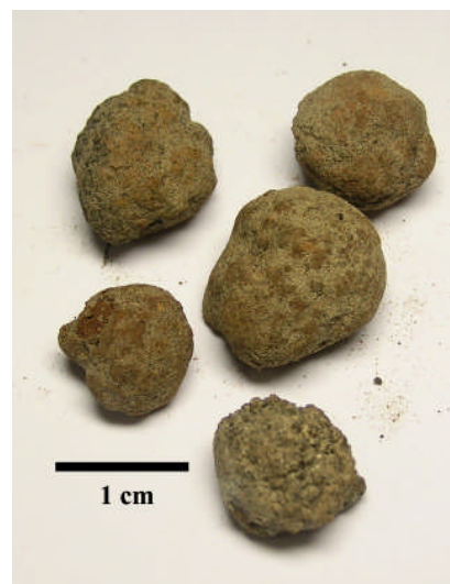
Fig 5. Sfäriska noder med jämn yta (Provtagningsstation 1981-47)

Bottenströmmarna kan mycket väl ha bidragit till den sfäriska formen genom att nodulerna roterades under tillväxten. I mer sandigt sedimentmaterial eller på bottenar som eroderats får nodulerna en slätare och jämnare yta (Fig. 5).