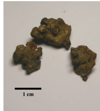
Fig 7. Oregelbundna noduler. (Provtagningsstation 1978-44)

Den flata typen av konkretioner hittas med skiftande storlekar och företrädesvis närmare kusten jämfört med de sfäriska. En speciell flat, rund och järnrik nodulvariant som hittas i sandiga sediment brukar kallas penningmalm (Fig. 8).