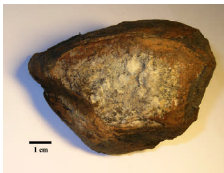
Fig 13. Oxidbeläggning av Fe på ytan av en sten. (Provtagningsstation 1983-36)