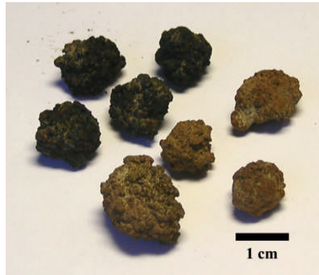
Fig 2. Svarta Mn-rika noduler och bruna som är Fe-rika. (Provtagningsstation 1982-37)

(hårdare) utfällningar. Variationen i oxidationsgrad kan även vara förklaringen till de situationer där antingen bara svarta eller ljusbruna noduler förekommer (Fig. 2).