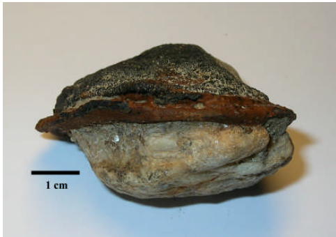
Fig 9. Fe- och Mn-rik gördel runt en sten, sett från sidan. (Provtagningsstation 1982-60)

Andra typer av flata konkretioner bildar ringformade gördlar runt stenar (Fig. 9 och 10), grus och sedimentfragment där ovensidan i regel har fått en svart manganrik beläggning (Fig 9).