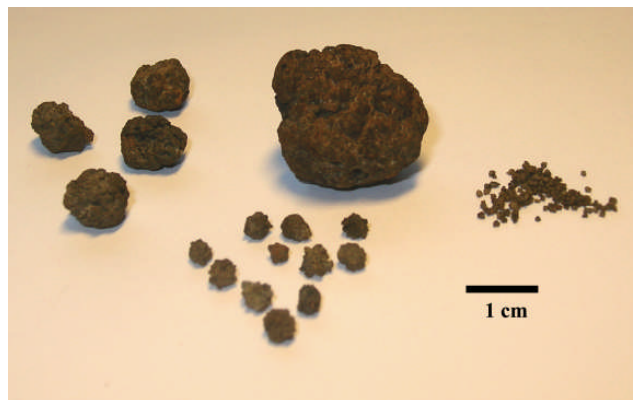
Fig 3. Noduler med olika storlek. (Provtagningsstationer 1981-57 och 1982-19)

Nodulerna har i de flesta fall en rundad form, de kan vara sfäriska eller flata. Sfäriska noduler i Bottenhavet och Bottenviken kan förekomma med olika storlekar, vanligen från omkring 0.5 mm till nära 3 cm i diameter (Fig. 3).