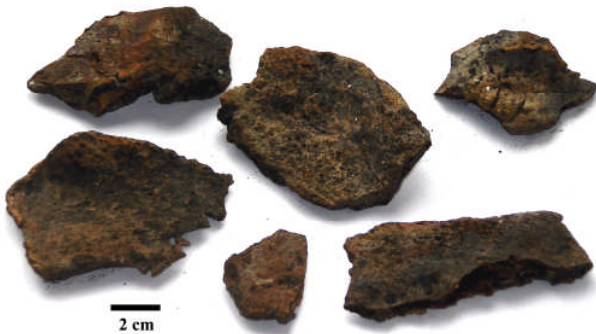
Fig 11. Skärvor av Fe-rik skorpa. (Provtagningsstation 1979-62)

Konkretioner förekommer också som järnrika skorpor av olika slag (Fig. 11 och 12) eller som tunna oxidbeläggningar på stenar (Fig. 13).