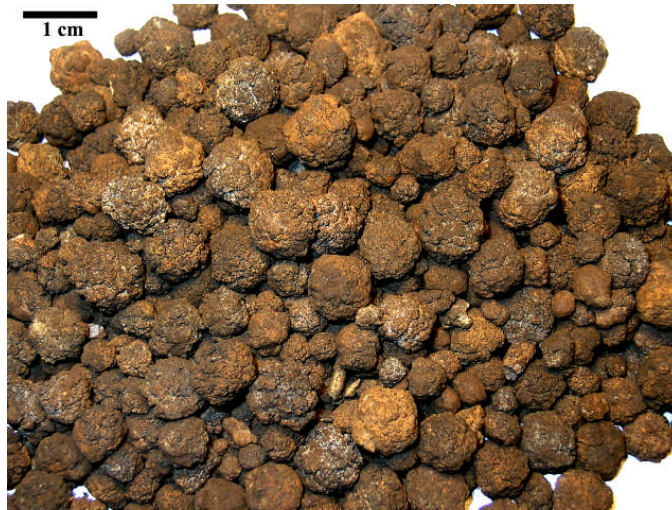
Fig 14. Rikligt med noduler som har hämtats upp från havsbotten vid en provtagningsstation (1983-13)

Förutom järn och mangan bakas även andra grundämnen in i konkretionerna, ex. As och P i de Fe-rika delarna och Cu, Ni, Zn och Ba associerade med Mn med de högsta halterna i de sfäriska nodulerna. Noduler kan lokalt hittas i stort antal (Fig. 14) och har därför ett stort ekonomiskt intresse som metallråvara.