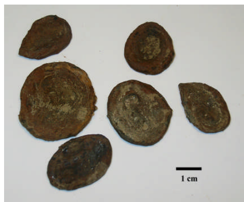
Fig 8. Flata, rundade noduler, s.k. penningmalm (Provtagningsstation 1982-60)

Den flata typen av konkretioner hittas med skiftande storlekar och företrädesvis närmare kusten jämfört med de sfäriska. En speciell flat, rund och järnrik nodulvariant som hittas i sandiga sediment brukar kallas penningmalm (Fig. 8).