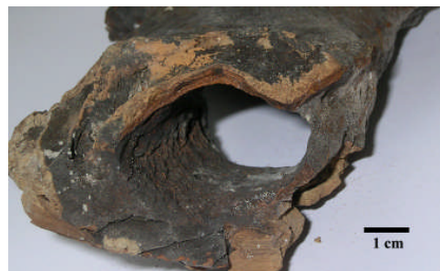
Fig 12. Skorpa där lera impregnerats av Fe. (Provtagningsstation 1979-65).