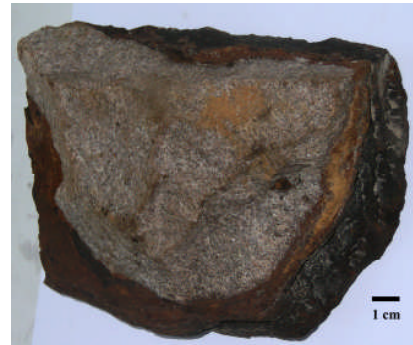
Fig 10. Fe- och Mn-rik gördel (underifrån) runt en sten (Provtagningsstation 1979-25)

Konkretioner förekommer också som järnrika skorpor av olika slag (Fig. 11 och 12) eller som tunna oxidbeläggningar på stenar (Fig. 13).