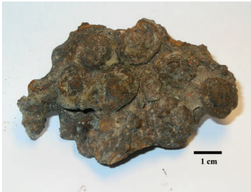
Fig 6. Sammanväxta noduler, bilden visar den mörka Mn-rika ovansidan. (Provtagningsstation 1976-29)

Noduler som ligger väldigt nära eller på sedimentytan i ett område med mycket svaga bottenströmmar kan växa ihop till en skorpa (Fig. 6) eller få en oregelbunden form (Fig. 7).