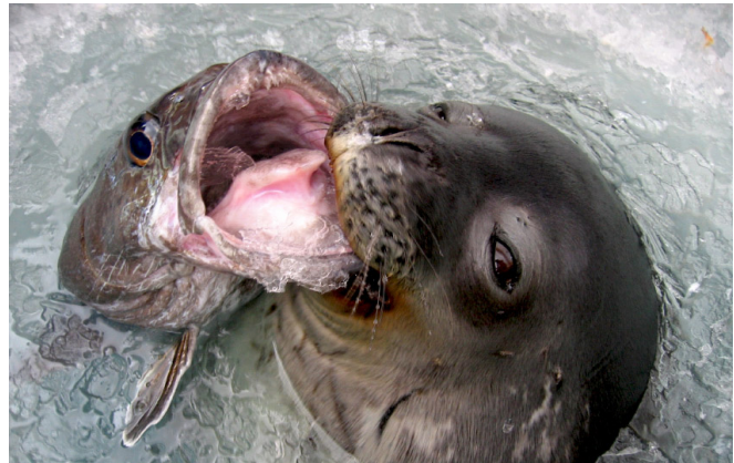
Abb. 2: Weddellrobbe mit gefangenem Antarktischen Seehecht ( Dissostichus mawsoni )

Hier haben wir also den klassischen Konflikt zwischen den Interessensgruppen Naturschutz und Fischerei (z.B. Brooks et al., 2016). Einige CCAMLR-Mitgliedsstaaten sehen ihre fischereilichen Interessen durch die mögliche Einrichtung des Weddellmeer-Schutzgebietes bedroht und arbeiten entsprechend dagegen. Auch die politische „Großwetterlage“ zwischen einzelnen staatlichen Akteuren spielt hierbei eine ge-